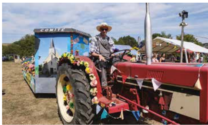
Grandes fêtes de la ruralité, les comices agricoles ont rythmé votre été en Sarthe. Chaque week-end, le Conseil départemental était présent avec un stand proposant un quiz sur la Sarthe et les compétences de la collectivité, avec des cadeaux à gagner !