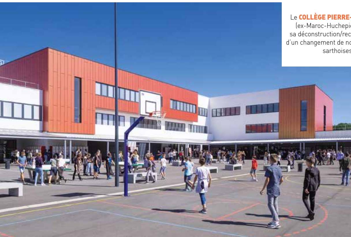
→ Le COLLÈGE PIERRE-GILLES DE GENNES DU MANS (ex-Maroc-Huchepie) a vécu une métamorphose et sa déconstruction/reconstruction s'est accompagnée d'un changement de nom. Une vingtaine d'entreprises sarthoises est intervenue sur ce chantier. (Capacité : 600 élèves)