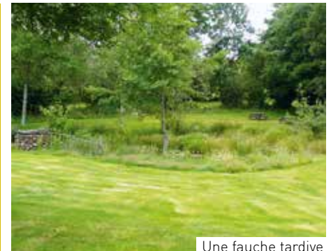
Une fauche tardive