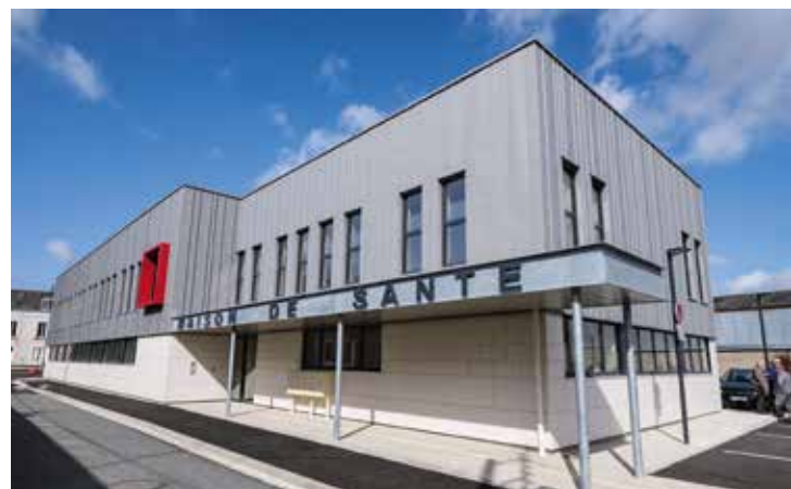
La maison de santé de Montval-sur-Loir. ↑