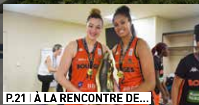
P.21 | À LA RENCONTRE DE...

Santé : le Conseil départemental relève le défi !