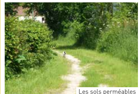
Les sols perméables