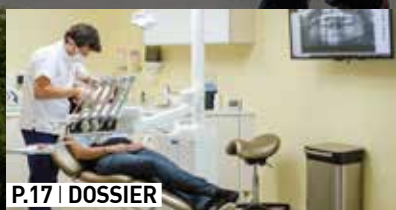
P.17 | DOSSIER

Santé : le Conseil départemental relève le défi !