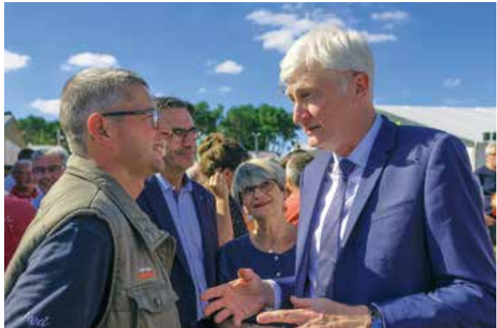
La rentrée, c'est aussi la Foire du Mans. ↑

Président du Conseil départemental Président du SDIS Député honoraire